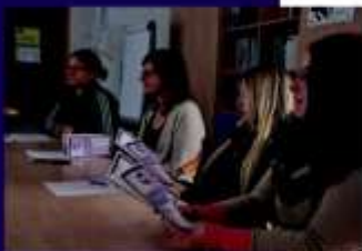
První německé pilotní setkání

Náš německý partner VHS Lkrs. Cham eV, zorganizoval první pilotní setkání projektu 4. listopadu 2015. Účastnilo se ho množství velmi zkušených školitelů: většina z nich měla alespoň šest let profesních zkušeností,